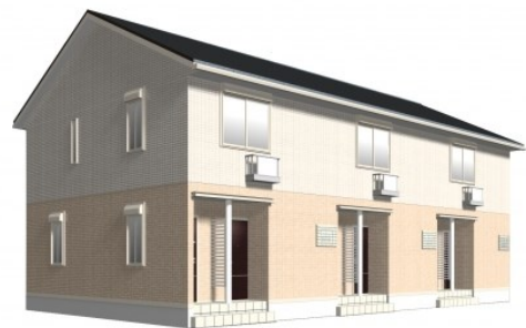
完成予想図につき、実際と異なる場合がございます