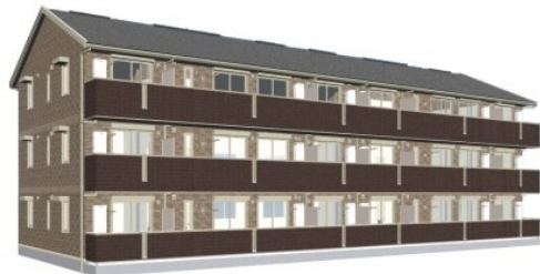
完成予想図につき実際と多少異なる場合がございます

2F以上,オートロック,モニタ付オートロック,角住戸,最上階,セキュリティ会社加入済